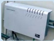
Equip de comunicacions