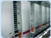
Inversors de corrent