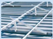
Estructura de suport