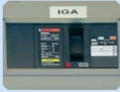
Posada en marxa de la instal·lació

No inclou IVA, obra civil complementària, taxes ni visats en cas que fosin necessaris.