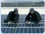
Muntatge de tot el conjunt